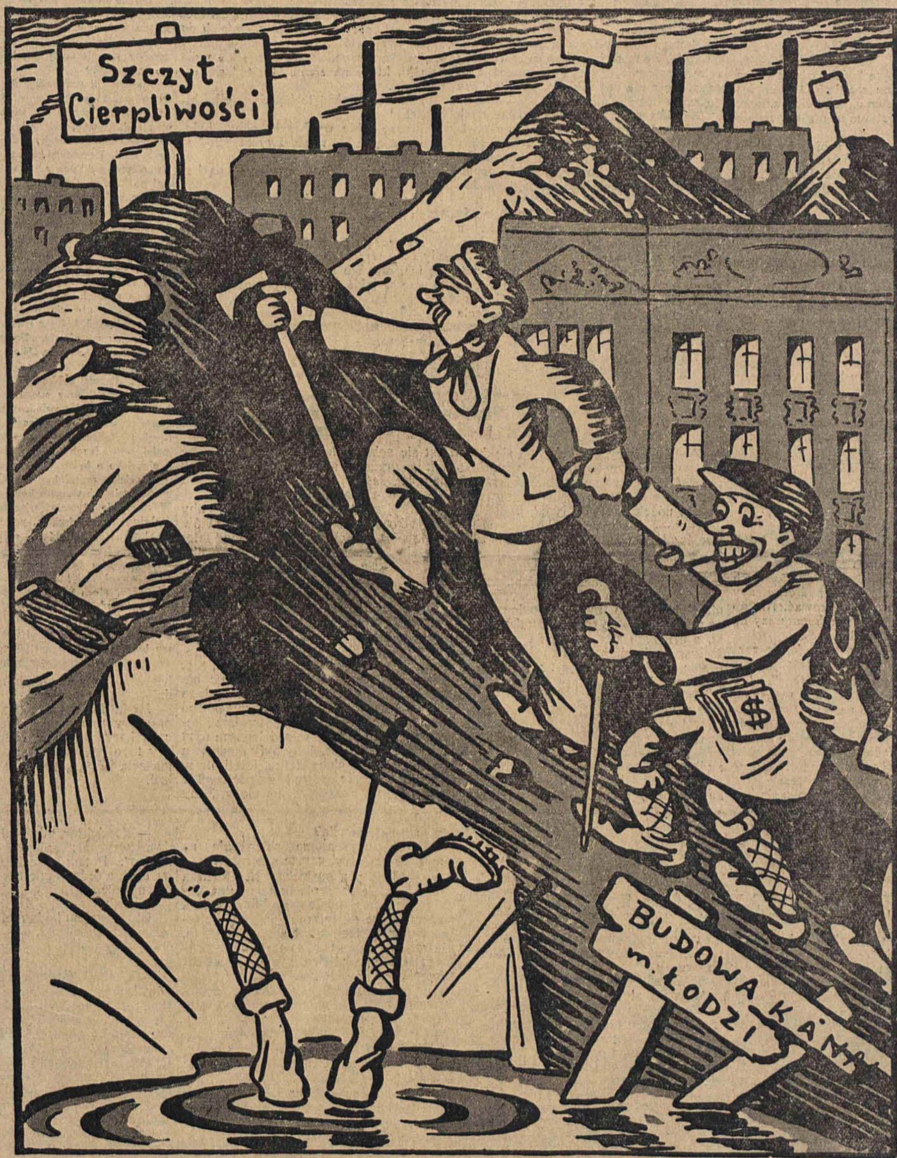
Z wędrowek po Łodzi