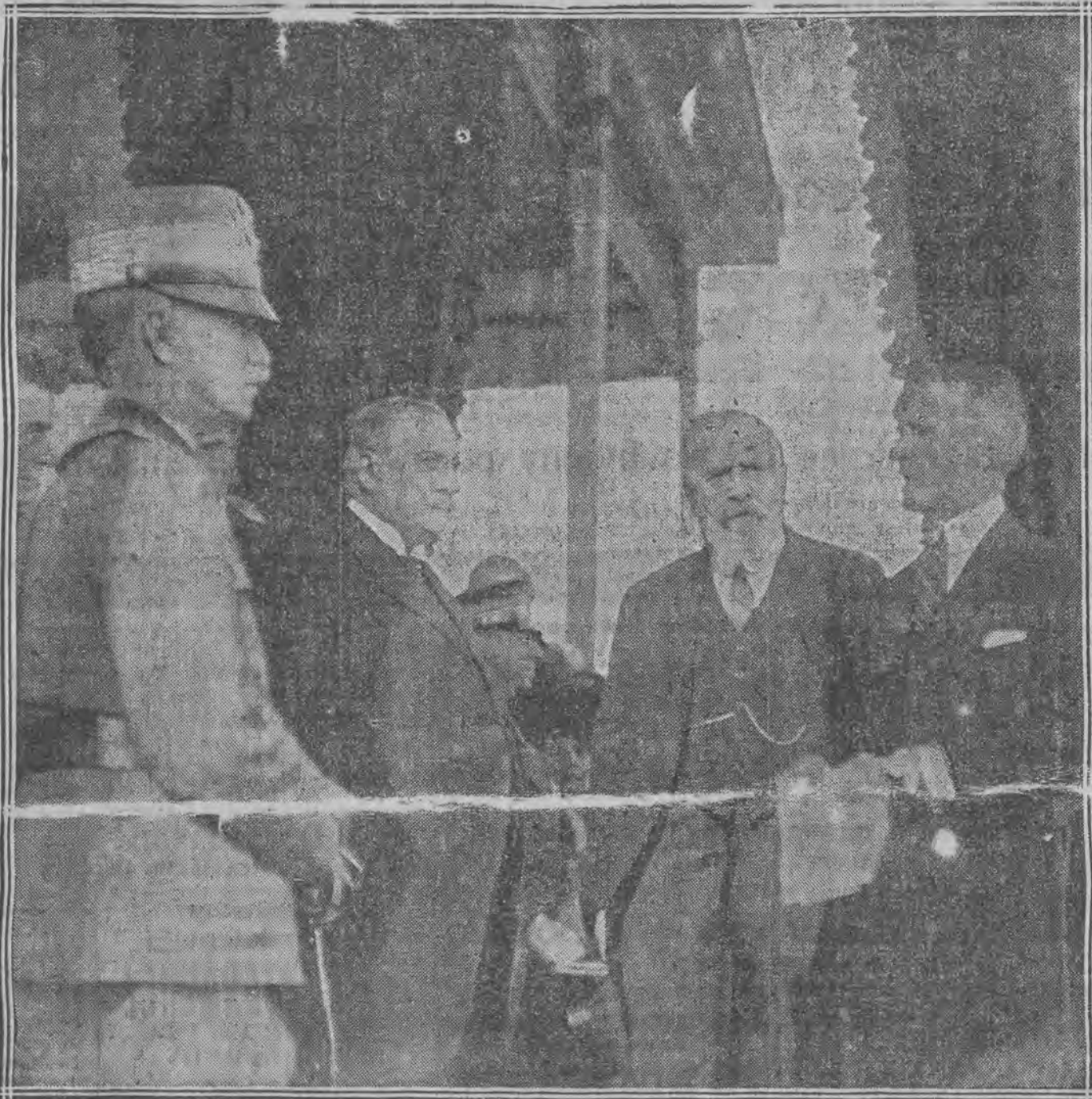
Król włoski odwiedził Turyn. Ilustracja nasza przedstawia go w chwili, gdy wita go zarząd miejski.

„Telegraphen Company” donosi, że gdyby próba utworzenia gabinetu koncentracyjnego nie powiodły się, wówczas król powierzy misję utworzenia nowego gabinetu Dawidowiczowi. Jak wiadomo, istnieje zamiar utworzenia gabinetu przed poniedziałkiem, w którym to dniu zbiera się Skupczyna.