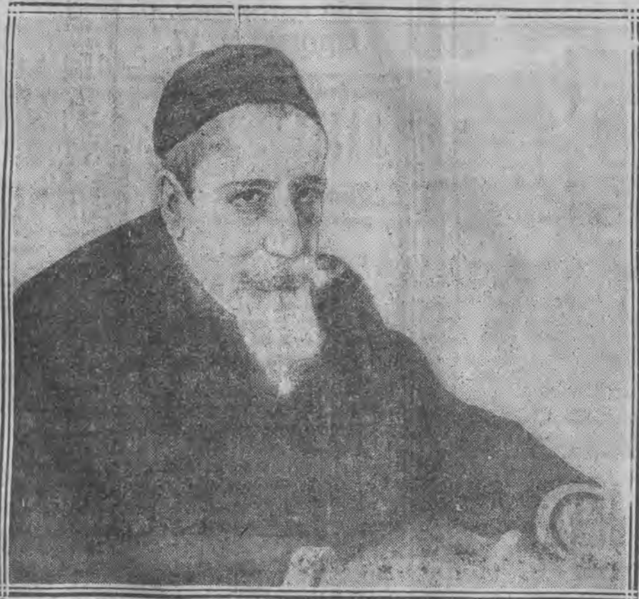
Ostatnia fotografia Anatola France'a, wielkiego pisarza francuskiego.