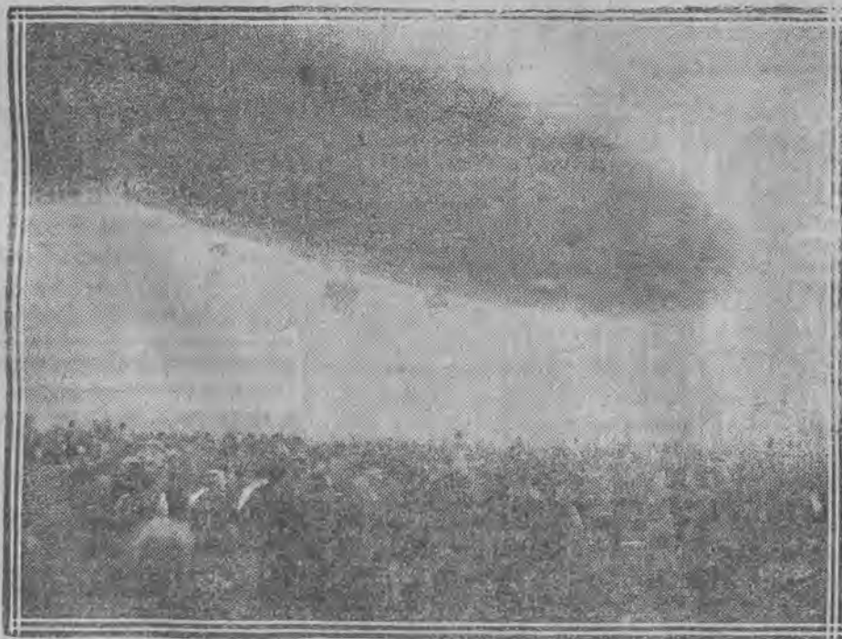
Zeppelin opuszcza się w Ameryce. Przed hangarem zgromadziły się tłumy publiczności.