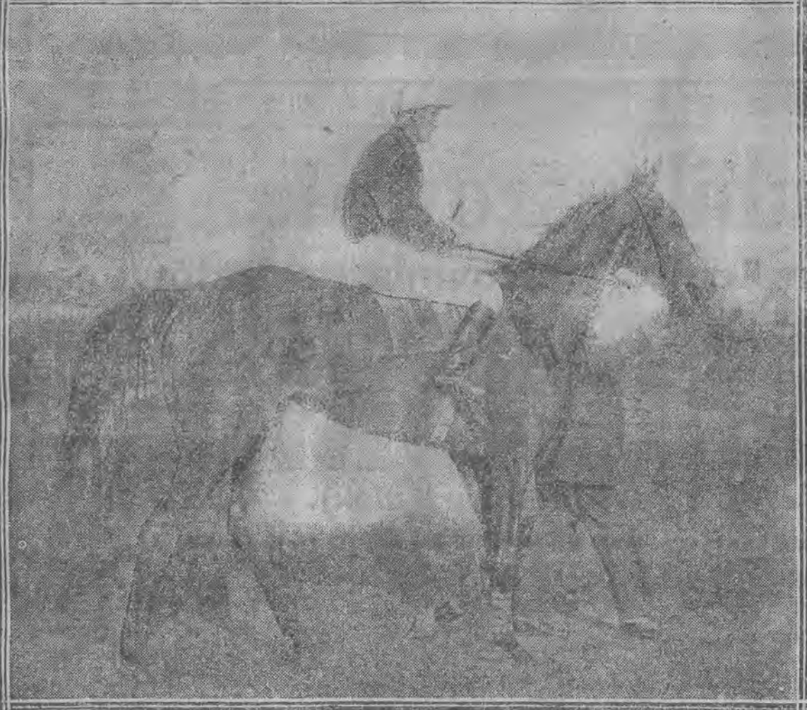
Najpiękniejsze konie wyścigowe sezonu angielskiego.