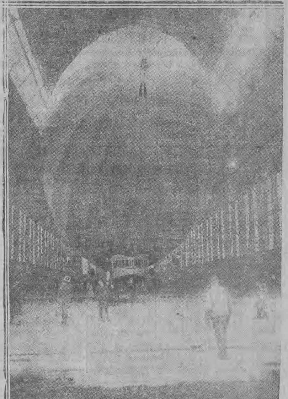
Zeppelin w hangarze amerykańskim.