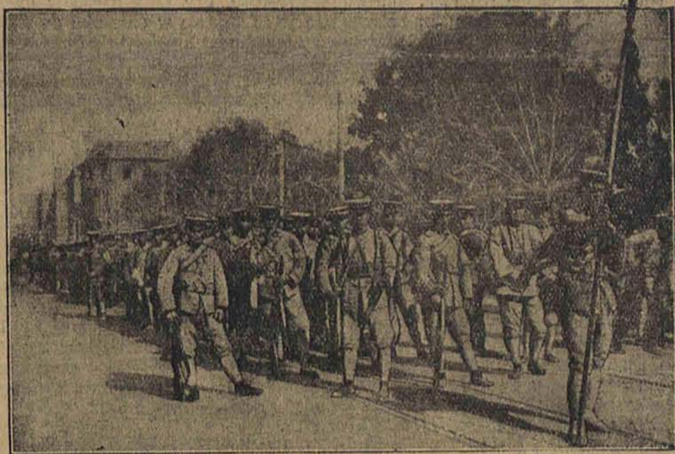
Rycina nasza przedstawia wy marsz wojsk chińskich na front.