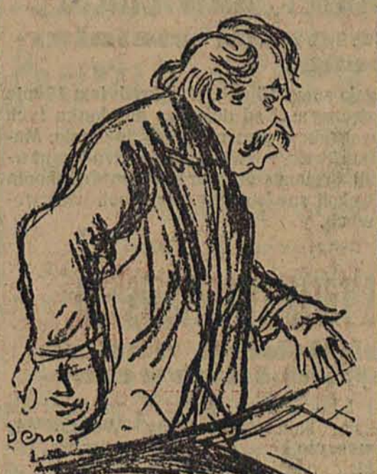
Briand na mównicy

PARYŻ, 23 października. (Polska Agencja Telegraficzna) Frakcja deputowanych socialistów postanawiała się dzisiaj rano nad sytuacją polityczną. W rezultacie obrad uważali zebrani