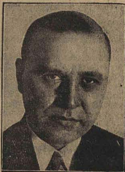
MINISTER ST. CAR.

na list otwarty adwokata Nagórskiego. — Minister Car odpiera zarzuty jakoby sprzeniewierzył się hasłom wolności i poszanowania prawa. „Ideologia Marszałka Piłsudskiego jest najpiękniejszym wcieleniem myśli państwowej”