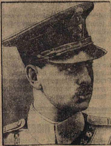
Bukareszt, 9 czerwca.

Od bukareszteńskiego korespondenta „Republiki”.