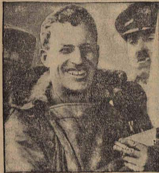
Kapitan Kingsford-Smith, zwycięzca Atlantyku.