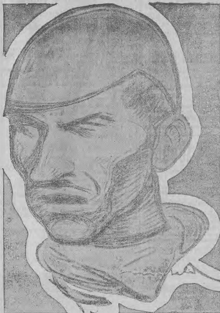
Ottavio Bottechia cyklista włoski światowej sławy, zdobywca „Tour de France”.