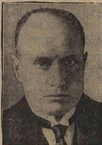
WIEDEN, 4 sierpnia.

Faszyści zaprzeczają pogłosce i widzą w niej tylko objaw walki z rządem.