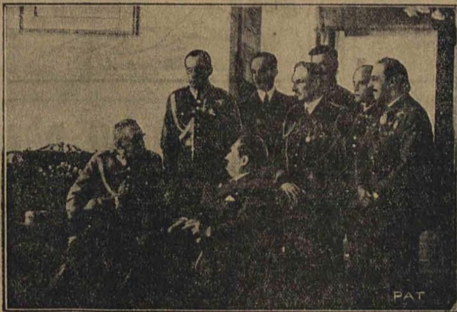
Bawiący w Polsce francuski minister lotnictwa p. Eynac, w rozmowie z Marszałkiem Piłsudskim podczas odwiedzin w Wilnie.