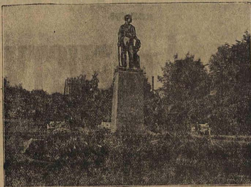
Piękny symbol Łodzi pracującej, ustawiony w parku im. Staszycy.