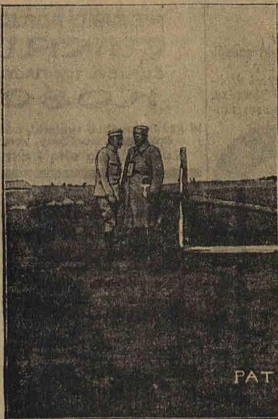
Komendant Piłsudski na froncie w roku 1914 wydaje dyspozycję obywatelowi Scevoli, dowódcy batalionu 1 p. p.