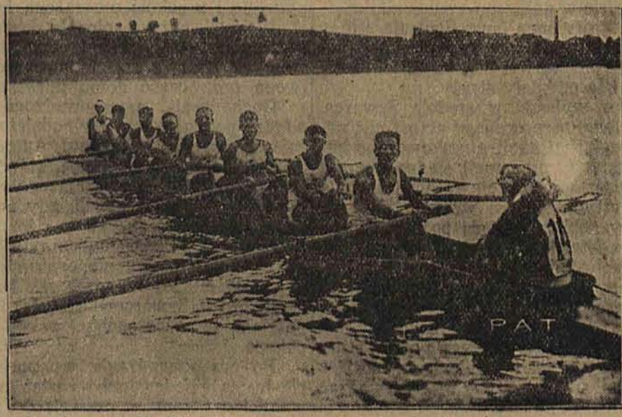
Zwycięska ósemka K. W. 1904 r. Poznań, która w biegu o nagrodę wędrowną Przewenta Rzeczypospolitej prof. I. Mościckiego po raz trzeci z rzędu zajęła pierwsze miejsce, zatrzymując tem samem na własność piękny srebrny puchar.