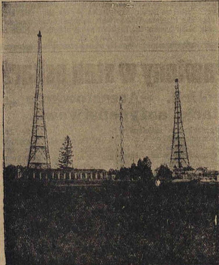
Nowoczesna wielka radiostacja ciatenowa we Lwowie