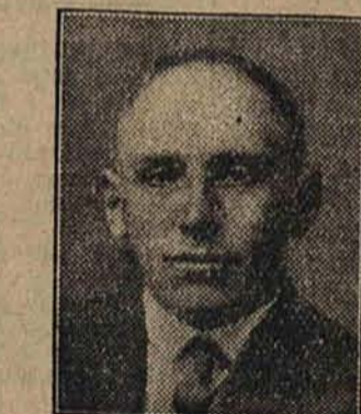
Pan A. K.: Wyraża nam swoje podziękowanie za tak skuteczny środek, jakim jest Silvikrin. Jak widać z załączonych fotografii, skutek jest również zadziwiający.