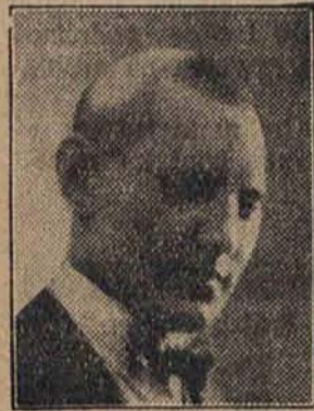
Pan W. D.: Wypróbowałem wszystkie inne środki, dopiero po zastosowaniu zalecanej przez W.Panów kuracji-włosów poszczycić się mogę wspaniałą czupryną. (Słowa te potwierdza załączonemi fotografiami, które podajemy).

Pewnem jest, że składniki „Silvikrin - kuracji - włosów w komplecie” nie mogą być przez coś lepszego zastąpione. Silvikrin zawiera bowiem obfitujące w siarkę składniki budujące włos. Obfitość siarki oddziałuje bardzo dodatnio jako siła produkcyjna na skórę głowy, usuwa wszelkie niedomagania uwłosienia i daje cebulkom włosowym treść, potrzebną do budowy włosa.