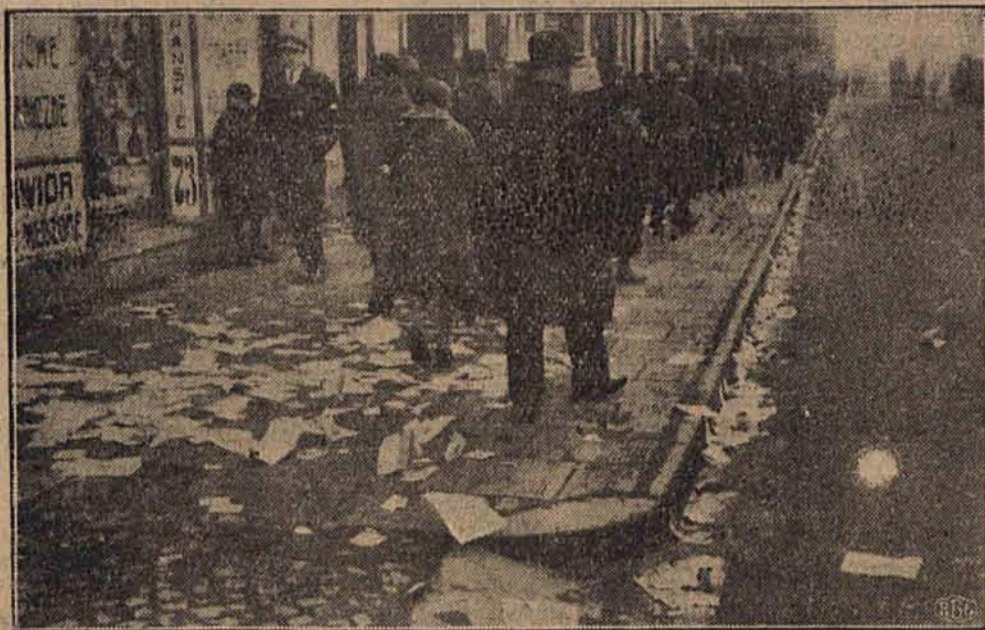
Ulica łódzka w dniu wyborów.