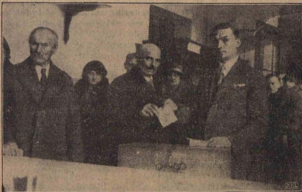
Składanie głosów w jednej z komisji obwodowych.