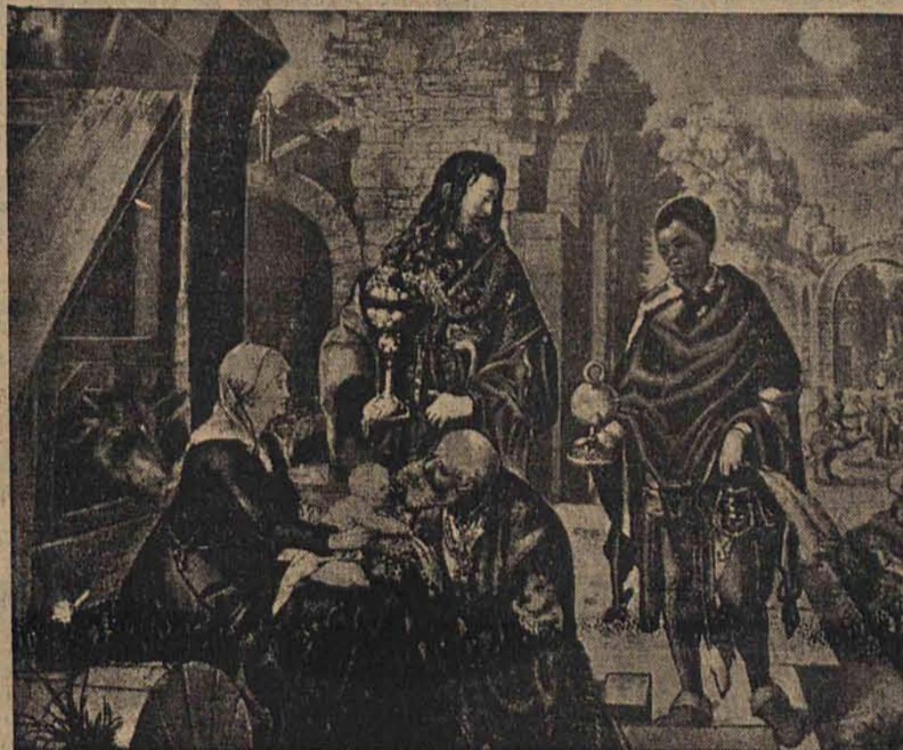
W dniu dzisiejszym świat chrześcijański obchodzi Święto Trzech Króli, którzy na wieść o Narodzeniu Chrystusa pośpieszyli złożyć mu hołd. Ilustracja nasza jest fotografią słynnego portretu Albrechta Dürera, przedstawiającego scenę przybycia trzech króli z darami do Betleem.