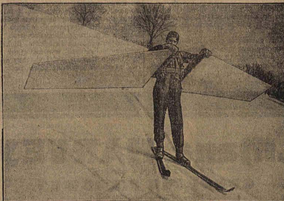
Jeden z wiedeńskich narciarzy skonstruował specjalne skrzydła, przy pomocy których pragnie pobić rekordy skoków na nartach.