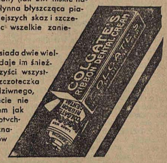
Duża Tuba Zł. 3.-

Pasta do zębów COLGATE posiada dwie wielkie zalety. Poleruje zęby i nadaje im śnieżny połysk, a równocześnie czyści wszystkie te miejsca do których szczoteczka dotrzeć nie może. Nic więc dziwnego, że żadna inna pasta na świecie nie cieszy się takim powodzeniem jak COLGATE. Ci wszyscy, którzy dotychczas nie mieli sposobności zaznajomienia się z pastą do zębów COLGATE mogą obecnie, za przesłaniem załączonego kuponu otrzymać bezpłatną próbną tubkę.