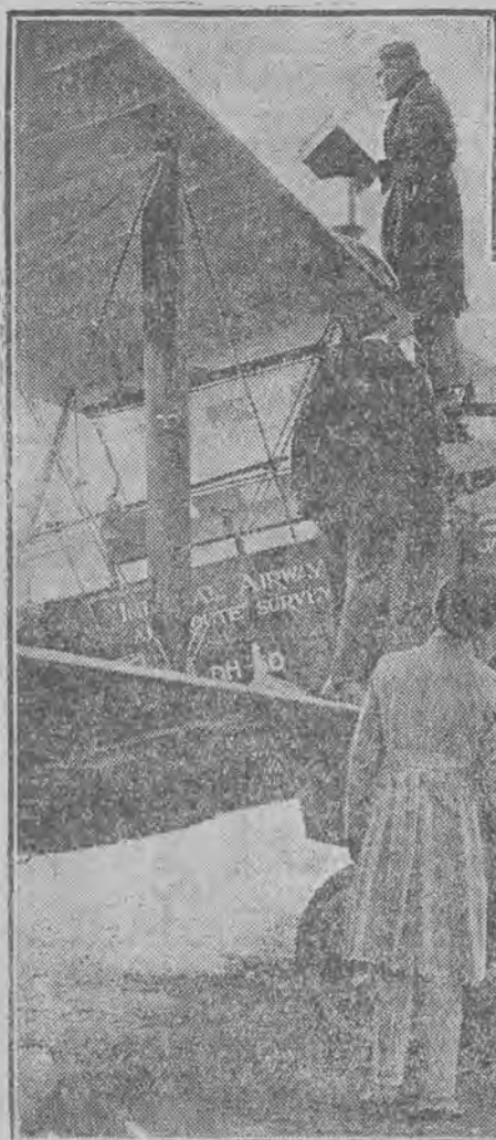
Na lewo: Przygotowania do odjazdu. Na prawo: Lotnik żegna się z żoną.