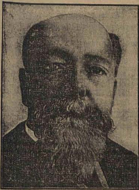
NOWOOBRANY PREZYDENT FRANCJI PAWEŁ DOUMER.

Paweł Doumer urodził się 22 marca 1857 r. w Aurillac (Cantal). Z początku uprawiał publicystykę, następnie przeszedł do polityki i został obrany w 1888 r. deputowanym z departamentu Aisne. Od r. 1912 zasiada w Senacie, jako przedstawiciel Korsyki. W gabinecie Bourgeois (1895-96) sprawował Doumer urząd ministra finansów. Zyskał sobie reputację dobrego i surowego administratora na stanowisku generał-gubernatora Indochin. Kandydował na stanowisko prezydenta republiki w r. 1906, ale uległ przy głosowaniu Falieres'owi, który otrzymał 449 głosów przeciw 371 głosom oddanym na Doumera. Piastował tę funkcję ministra finansów w gabinecie Brianda (1921-22). W r. 1927 obrany został Doumer większością 238 głosów przeciw 35 prezesem Senatu, które to funkcje sprawuje do ostatniej chwili.