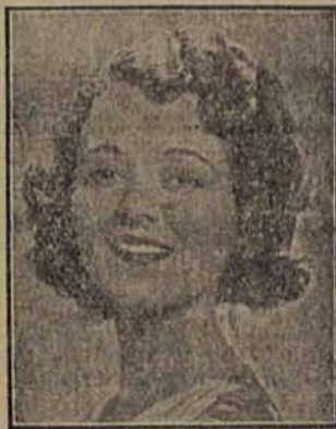
Janet Gaynor Charles Farrell wkrótce