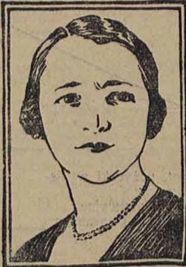
Dr. N. G. Payot 12, rue Richempanse Paris

słyszała Pani zapewne o słynnym Salon de Beauté Dr. N. G. Payot. Broszurka Dr. N. G. Payot „Fizyczna kultura twarzy” tłumaczy jak stosować jej krem No. 1, płyn No. 1 i płyn No. 2 przy specjalnych ćwiczeniach, którym Salon Dr. N. G. Payot zawdzięcza swą sławę.