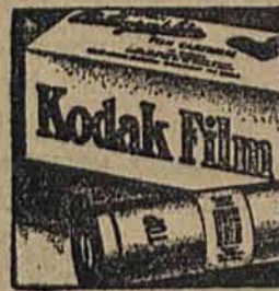
Do konkursu używajcie błon Kodaka na których zawsze polegać można.

Nie zwlekaj! Informacje o konkursie można otrzymać w każdym składzie materiałów fotograficznych, lub w biurze Konkursu, Kodak, Warszawa, Plac Napoleona 5