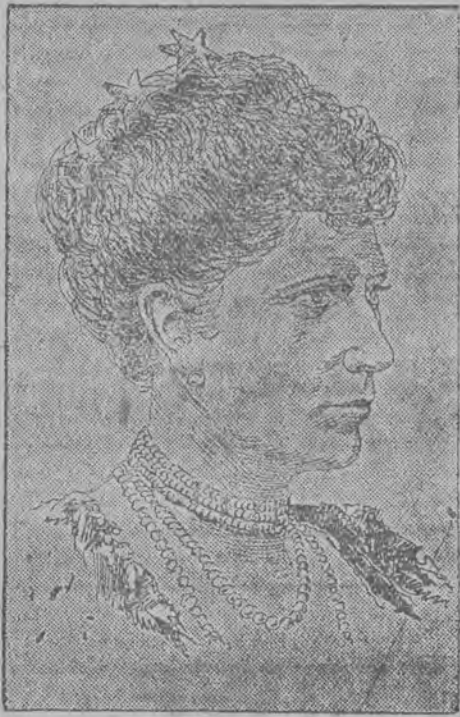
Królowa Luiza duńska, żona Fryderyka VIII, zmarła ubiegłej soboty wskutek zapalenia płuc, mając lat 75.

W czerwonej Rosji życie dotychczas jeszcze się nie unormowało. Masowe wyroki śmierci. — 8-godzinny dzień pracy jest fikcją. — Bomby na ulicach. Kolejnictwo „pod psem” — Smutna dola robotników.