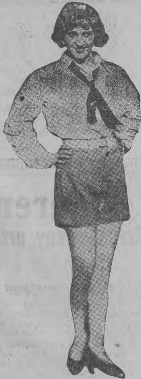
Najnowsza moda we Florydzie (Ameryka) przewiduje na plaży krótkie spodenki, bluzkę-koszulę i gołe nóżki.