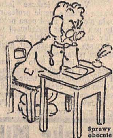
Sprawy podatkowe i budżetowe sprawiają obecnie wiele kłopotu i wpływają, oczywiście, ujemnie na samopoczucie . . . Aspirina usuwa ból głowy i ułatwia myślenie.

Przeciwko bólowi głowy, zębów i kończyn, przeciwko reumatyzmowi, grypie i wogóle wszelkim zaziębieniom zawsze najlepiej pomagają niezawodne tabletki Aspirin. Na każdej tabletkie i na każdym opakowaniu (po 20 lub 6 tabletek) znajduje się krzyżowy napis BAYER, który stanowi markę ochronną oryginalnej Aspiriny. Do nabycia we wszystkich aptekach.