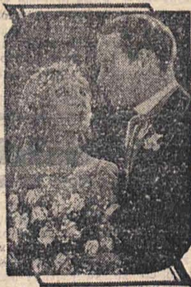
Anna Harding — Clive Brook — Conrad Nagel w filmie p. t.

Dziś, we wtorek, o godz. 17.10—17.33 przed mikrofonem stacji krakowskiej (transmisja Rozgłośni Łódzkiej P. R.) prof. uniwersytetu dr. Odo Bujwid, niestrudzony propagator esperanta, wygłosi po esperancku odczyt p. t. „Zemehof kaj lia eltrovo de helpa linguo” (Zamenhof i jego wynalazek języka światowego).