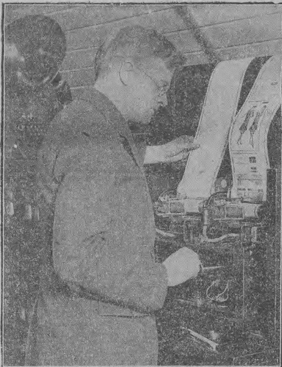
Amerikanin Renger wynalazł aparat, dzięki któremu można na drodze radiotelegraficznej przesyłać rysunki i fotografie.