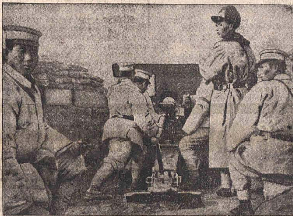
Na front chińsko-japoński jadą olbrzymie transporty wojsk pieszych, kawalerji, artylerji i wojsk technicznych. Na zdjęciu widzimy artylerię chińska na stacji rowisk.

W dzielnicy międzynarodowej Szanghaju ogłoszono stan oblężenia. Od godziny 10-ej wieczór do 4-ej rano mieszkańcom nie wolno ukazywać się na ulicach. Wydano zakaz zgromadzeń publicznych. Władze koncesji utworzyły 3 komisariaty, których zadaniem jest pomoc dla garnizonu europejskiego, podział aprowizacji i wszelkiego rodzaju sprawy techniczne, związane z wyjątkowym położeniem dzielnicy międzynarodowej. Sytuacja aprowizacyjna dzielnicy międzynarodowej polepszyła się, hale targowe zostały otwarte, banki