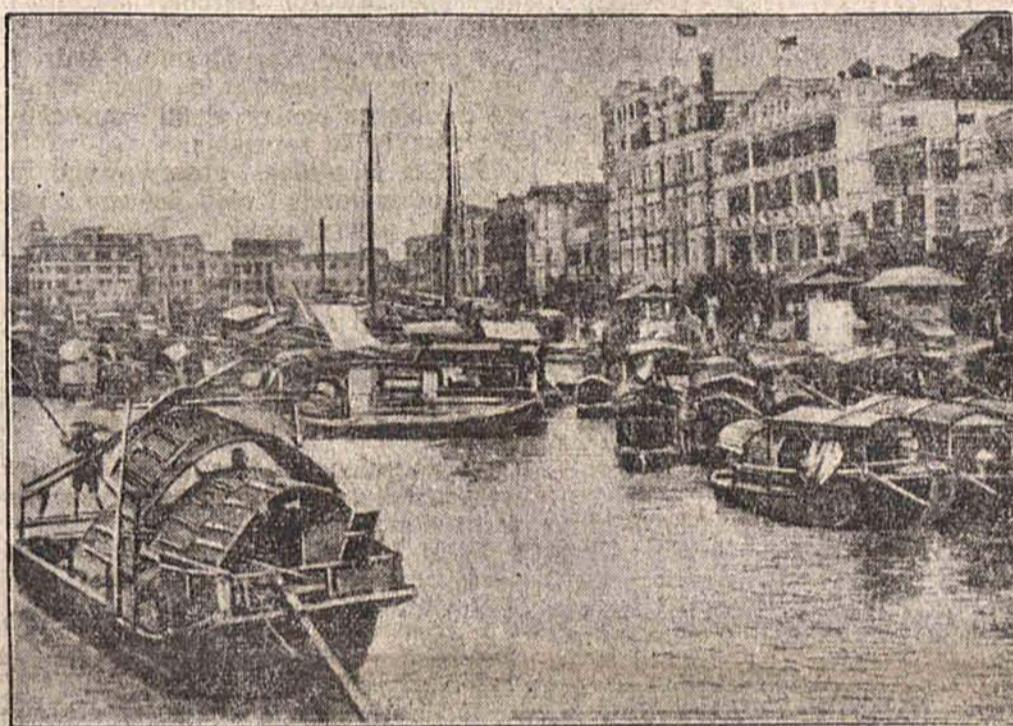
Jak doniosły depesze, wojska japońskie wylądowały pod Kantonem. Nasza ilustracja przedstawia widok portu.

Parowiec angielski przewożący z Tien-Tsinu żołnierzy angielskich doniósł, że w chwili gdy przepływał on między kłazownikami japońskimi a portem Wusung, był ostrzeliwany przez kłazowniki. Parowiec nie doznał szwanku. Według informacji chińskich jeden z kłazowników japońskich zatonął w porcie Wusung.