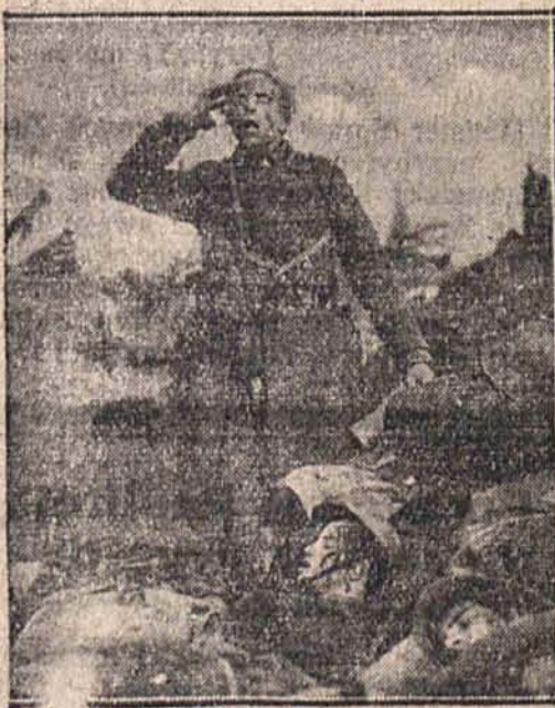
Scena z wstrząsającego filmu

Szwedzkie koleje państwowe zakupią 32.500 tonn węgla polskiego.