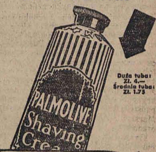
Duża tuba: zł. 4.- Średnia tuba: zł. 1.75

Powinien Pan spróbować kremu do golenia Palmolive — ale na nasz koszt. W tym celu prosimy wypełnić poniższy kupon i nam nadesłać, a otrzymamy Pan bezwzględnie tubę Palmolive, wystarczającą na 7 razy golenia.