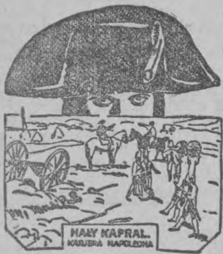
MAŁY NAPRAL. KARJERA NAPOLEONA

Ceglana 49 Tel. 41-32. Choroby skórne, we- neryczna moczościowa Leczenie sztucz- nym słońcem wy- zynowem. Przyjmuje od g. 8 do 10 rano i od 5-8 w.