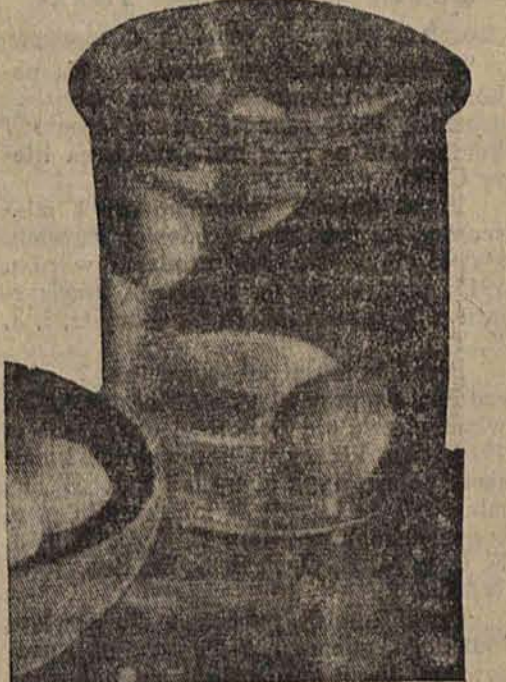
Jaja świeże opadają na dno, mniej świeże zanurzają się nieco, nieświeże pływają po wierzchu.

Rozmaitość zabarwienia jaj pochodzi od rodzaju pożywienia, jak zwierzę dostawało. Ziarno, mączne potrawy i ziemniaki powodują żółty barwik. Żółtko będzie czerwone, jeśli ptak dostawał resztki mięsa. Najsmaczniejsze są drobne