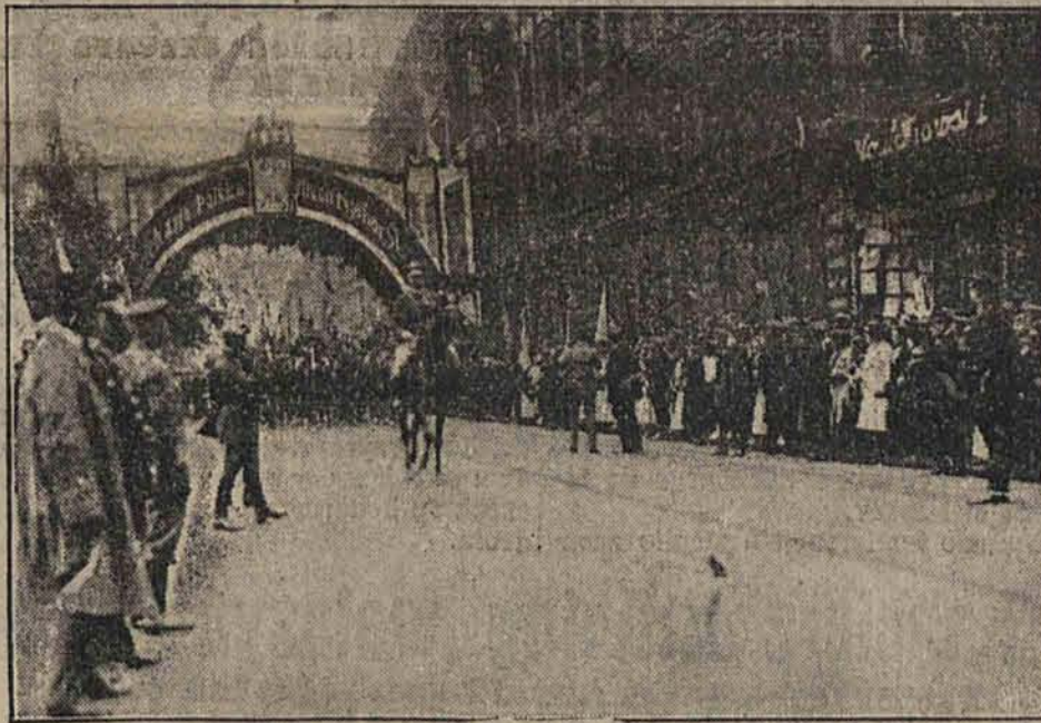
Pierwsze oddziały wojska polskiego wkraczają do Katowic