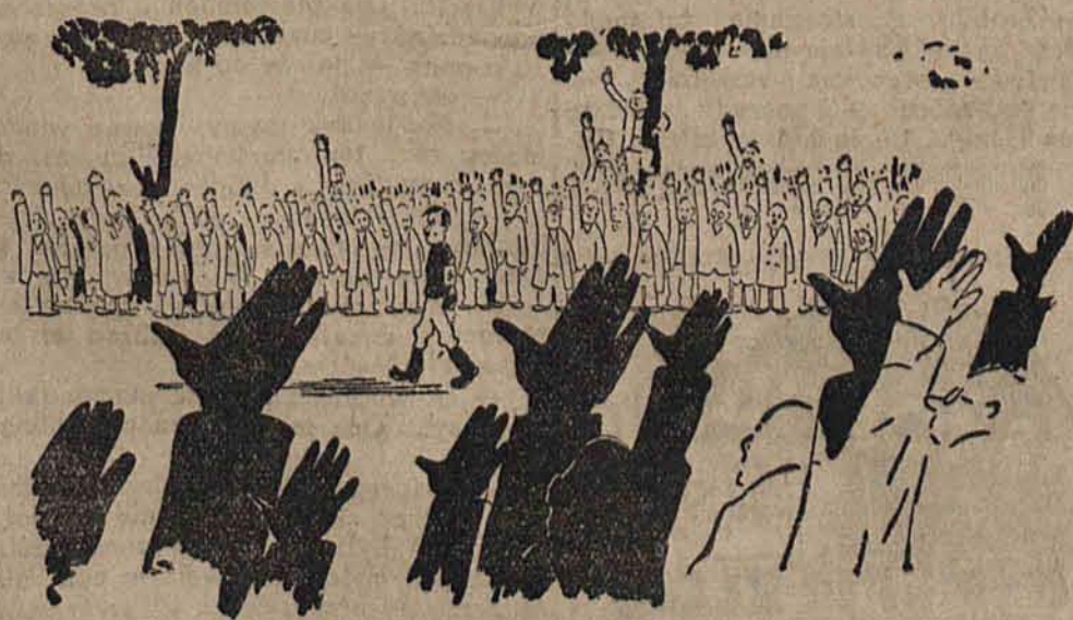
Hitler: — Niechaj wszyscy, którzy pragną, abym kopnął ich w d... podniosą natychmiast ręce!