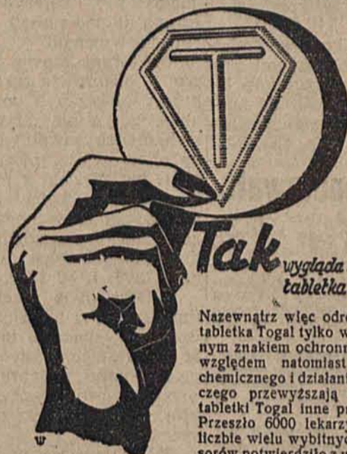
Tak wygląda każda tabletka Togal

Rząd belgijski zaopiekował się emigrantką.