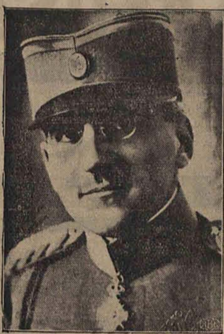
KRÓL JUGOSŁAWJI, ALEKSANDER I

Dziś przyjeżdżają do naszego miasta dostojni goście, przedstawiciele zaprzyjaźnionego z nami narodu jugosłowiańskiego.