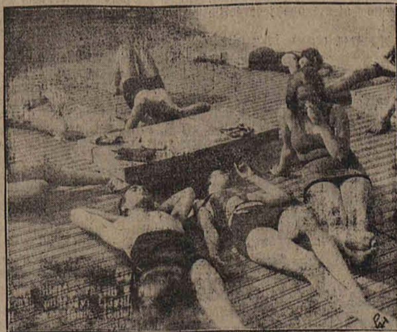
Od kilku dni panuje w Belgji taka pogoda, że mieszkańcy w strojach kąpielowych wygrzewają się na dachach swych domów. My na taką pogodę musimy jeszcze trochę poczekać.