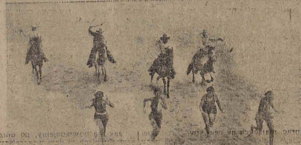
Wygląda to groźnie, jest jednak tylko rozrywka: „kowboje” polują na ludzi.