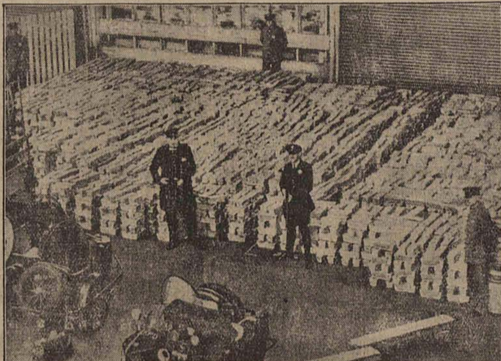
W myśl ostatniej umowy, Anglja pokrywa część swych długów wojennych Ameryce w srebrze. Na zdjęciu widzimy 9000 sztab srebra, wartości 5 milionów dolarów, przeznaczonych do transportu z Indji do San Francisco.