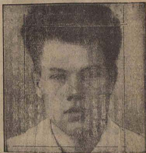
VAN DER LUEBBE

Zastrzeżenia te uzależniają wypełnienie poszczególnych warunków w punkcie 1-ym od wyboru obrońcy, mającego prawo stawania przed sądem w Niemczech, w punkcie 2-im od zgody obrońcy niemieckiego i od decyzji sądu, w 5-ym od decyzji sądu przy równoczesnym stwierdzeniu braku okoliczności, przemawiających za tajnością, w 9 od decyzji sądów, względnie oskarżonego, w 10-ym od rozstrzygnięcia władz