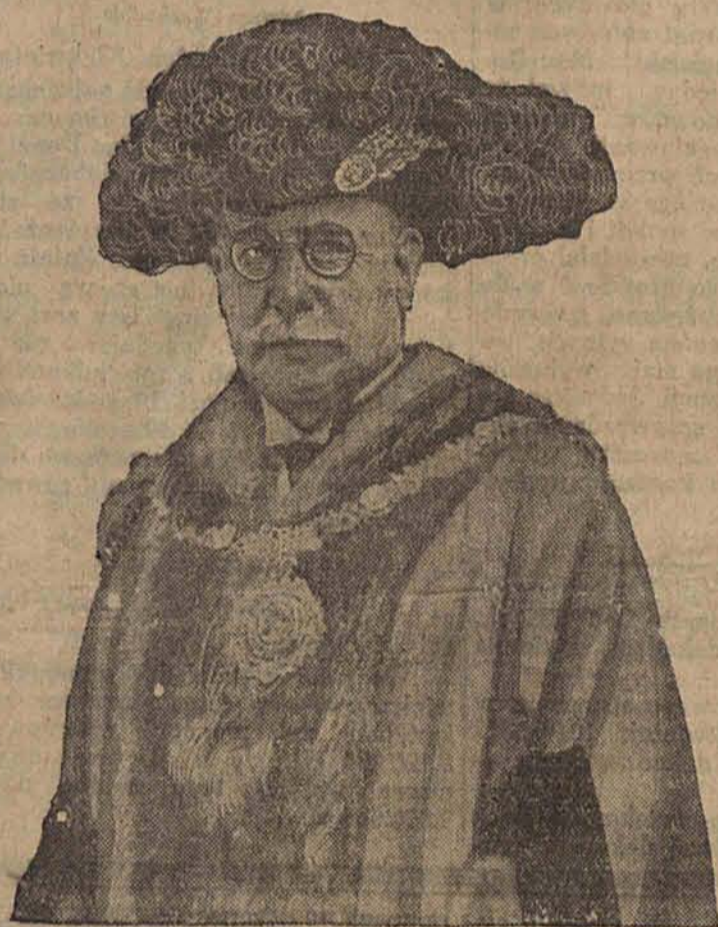
Nowoobрани lord — major Londynu w urzędowym stroju.