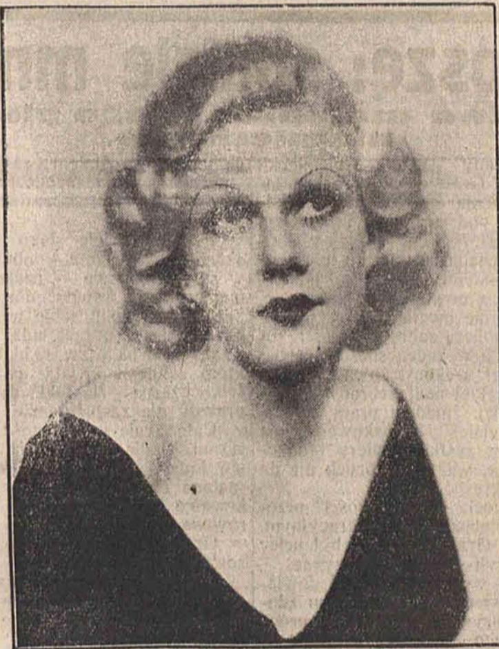
Słynna platynowa blondynka Jean Harlow uważana jest za najpiękniejszą kobietę sw. iata.