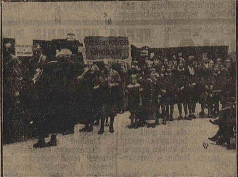
W pierwszy dzień subskrypcji Pożyczki Narodowej publiczność tłumnie obiega kasy banku, podpisując deklaracje pożyczkowe. Na zdjęciu grupa działwy szkolnej zdaża w halu Banku Polskiego. Na transparentie napis: „Niesiemy Pożyczkę Narodową”.