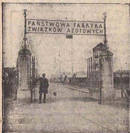
Wjazd do zakładów chemicznych w Mościcach.

Pracuje tam 1,600 robotników w dzień i w nocy, w niedziele i najbardziej uroczyste święta Wizyta „Republiki” w najnowocześniejszej fabryce Polskiej wytwarzającej najlepsze w Europie nawozy sztuczne