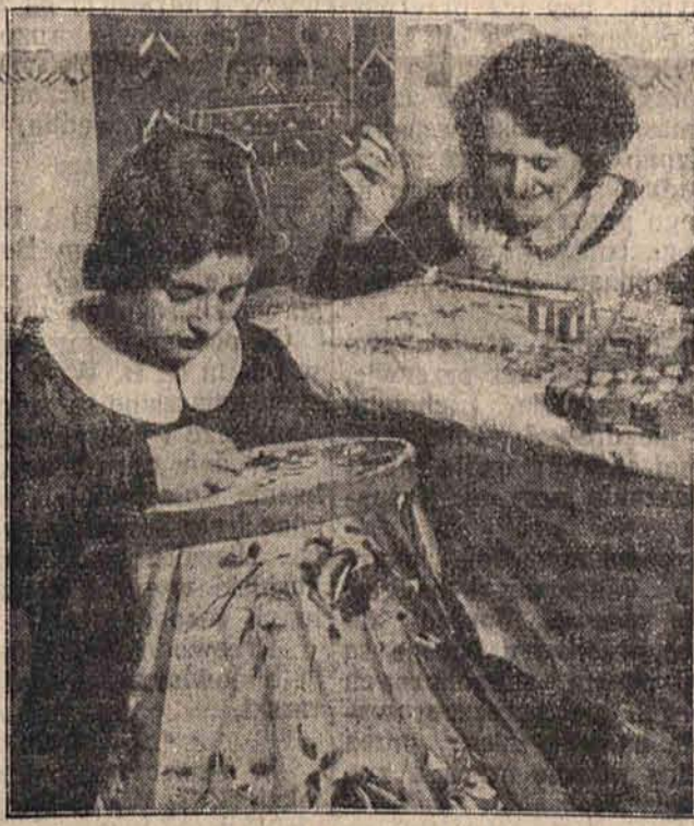
Mussolini rozkazał — i oto wszystkie kobiety włoskie pilnują domowego ogniska, zajmując się robotkami i nie myśląc wcale o zabawie i rozrywkach.