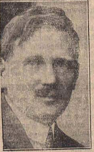
Posel Deutsch wódz Schutzbundu.

...rzecz, że Heimwehra liczyła się z możliwością. Na wiele miesięcy przedtem, w organizacji tej urządzono specjalne kursy telegraficzne, telefoniczne i pocztowe. Ale mimo wszystko, w razie strejku generalnego, rezultat byłby inny. Okazało się jednak, że organizacja Schutzbundu w obecnym momencie zupełnie niemożliwa. Przerwali pracownicy elektrowni. Robotnicy kolejni, pracownicy pocztowi, gazownicy pozostali przy pracy. Ogłosili neutralność i to spowodowało zupełną, militarną obronę, klęskę socjalistycznej obrony.