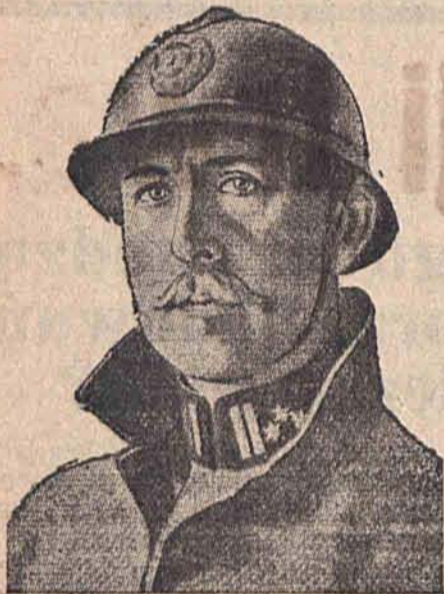
Król Albert I.