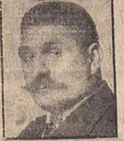
Otto Bauer przywódca socjalistów austriackich.

wyrywa się podłogi, oczywiście nieraz cały majątek rodziny ulega zniszczeniu. Dzieje się to w czasie, gdy żony z podniesionymi rękoma stoją pod ścianą i przypatrują się plądrowaniu ich mienia.