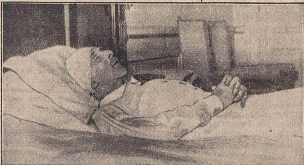
S. p. król Belgii Albert I na łożu śmierci w zamku Laeken pod Bruksela.

(Pat) Na Kubie powstał nowy ruch przeciwko rządowi, który rozszerza się szybko i objął już część armii.