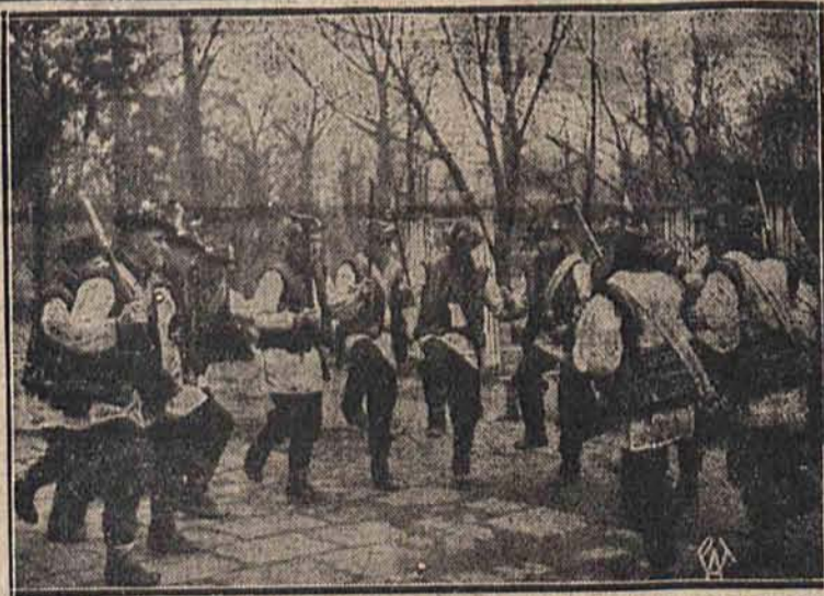
Do Warszawy przybył na kilka występów zespół teatru regionalnego z Zabiego. Przedstawienia te odbyły się staraniem Tow. Przyjaciół Huculszczyzny. — Na zdjęciu — taniec huculek na placu przed Domem Żołnierza