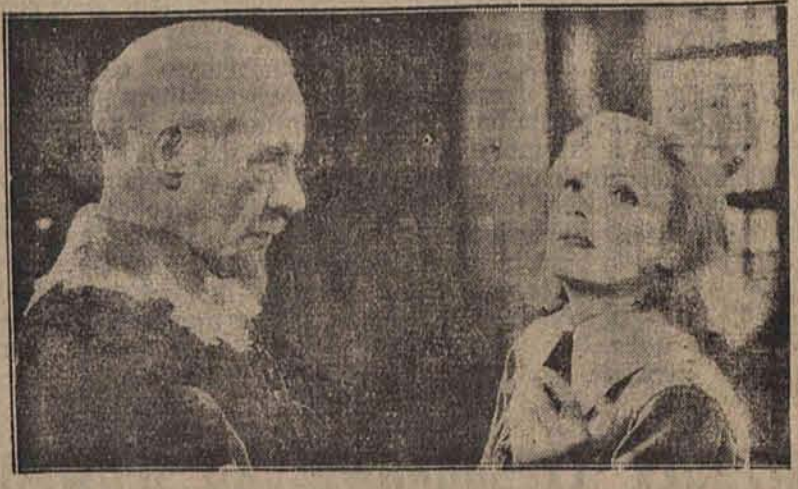
Scena z potężnego filmu „Królowa Krystyna” z Gretą Garbo, Lewis Stone, John Gilbertem, reż. R. Mamoulliana. Obraz wyświetla codziennie z niezwykłym powodzeniem Kino „CASINO”. Dziś pocz. o godz. 12-iej.

W czasie wybierania nieczystości z domu biologicznego na ulicy Bazarnej Nr. 3, wydobyto zwłoki dziecka, płci żeńskiej, liczącego około 2-ich miesięcy. Zwłoki znajdowały się w stanie częściowego rozkładu, co wskazywało, że przebywały w dole od dłuższego czasu. Trupa przesłano do prosectorium. Wszczęto poszukiwania za wyrodną matką.