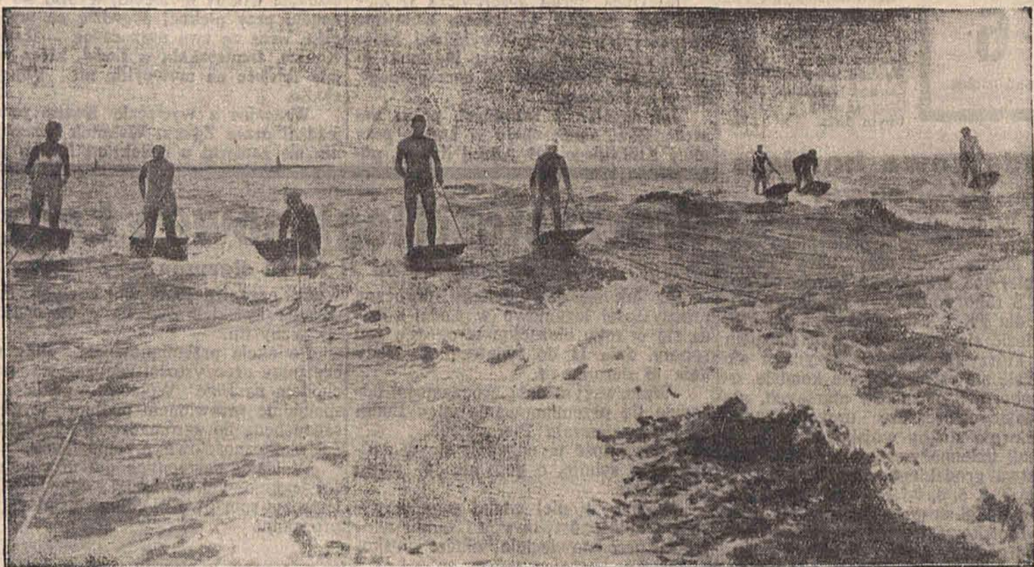
Jazda na falach popularyzuje się w Stanach Zjednoczonych coraz bardziej. Jazda taka nie jest łatwa — można bardzo łatwo spaść z deski i dlatego sport ten mogą uprawiać tylko bardzo zdolni pływacy.