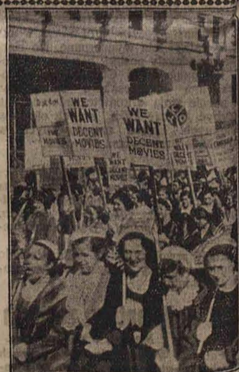
Studentki nowojorskie zorganizowały w tych dniach demonstrację, protestując przeciwko produkcjom filmów, obrażających moralność publiczną.