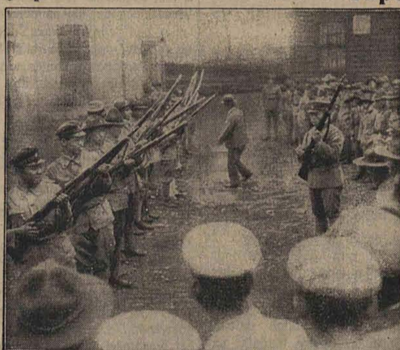
W Japonji cała młodzież przechodzi wyszkolenie strzeleckie. Na zdjęciu widzimy ćwiczących, pod kierownictwem wojskowego instruktora, uczniów.