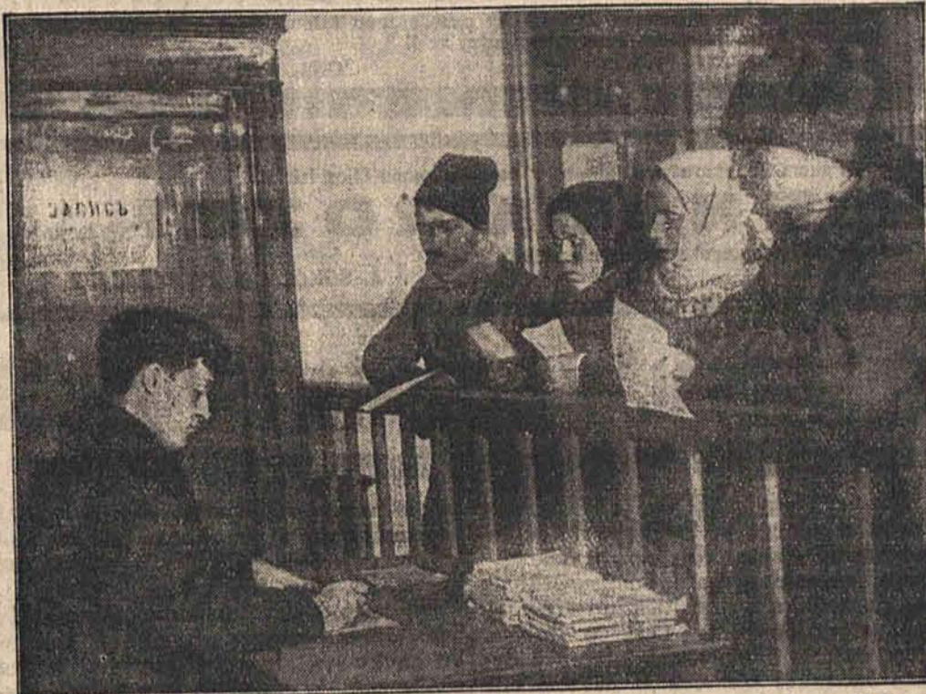
W Sowietach zawarcie związku małżeńskiego jest bardzo nieskomplikowane. Wystarczy złożenie zwykłego meldunku w urzędzie rejestracyjnym.

można raczej powiedzieć, że łatwość, z jaką ludzie wierzą w wynalazki, przekroczyła nawet granice zdrowego rozsądku i stała się gruntem, na którym zeruje blaga i wyzysk. T.