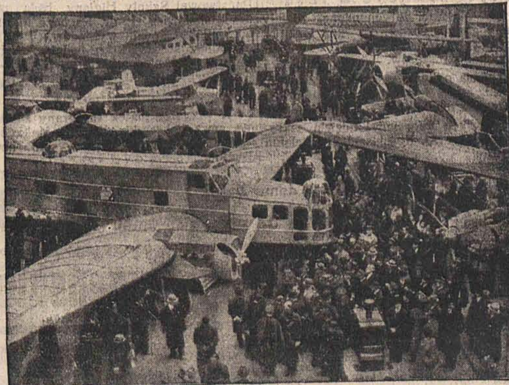
Prezydent Francji Lebrun dokonał otwarcia międzynarodowej wystawy lotniczej w Paryżu. Na zdjęciu widzimy wielkie bombardowce francuskie.